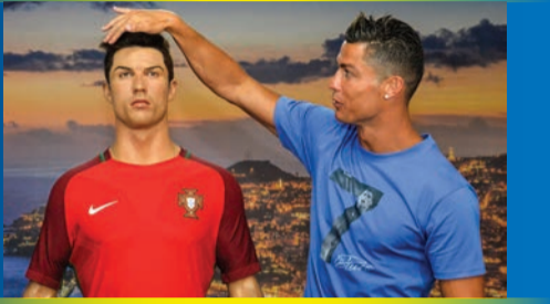
براهوی پیشبرکتی ژماره ی پیشور

به کورتترین و جوانترین لیدوانت لهسه ر نهم وینه په خلالت وهربرگره کورته نامه پک لهگه ل ناوی خوت بنیزه بو ژماره ته له فونتی: 0750 833 3555